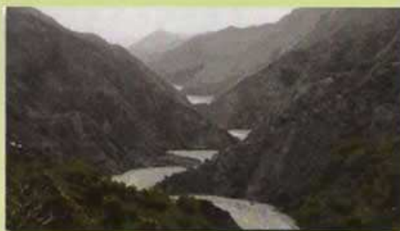
Fiumara non regimata e con numerose frane sui fianchi

I grossi muraglioni laterali, concatenati con le briglie, permettono: