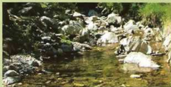
Alveo di un torrente

La loro sistemazione consente di raggiungere un giusto equilibrio fra il corso d'acqua ed il territorio circostante, in funzione del conseguente rallentamento della velocità e della forza erosiva dell'acqua.