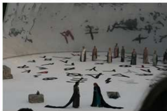
I soci del Lions Club di Capo d'Orlando, nei giorni 30 e 31 di maggio, hanno assistito, al Teatro Greco di Siracusa, alle rappresentazioni delle tragedie greche "Medea" ed "Edipo a Colono".