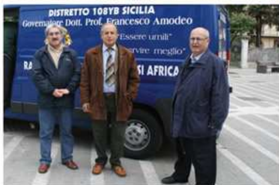
Sosta del furgone lions per la raccolta degli occhiali usati in P.zza Matteotti a Capo d'Orlando.