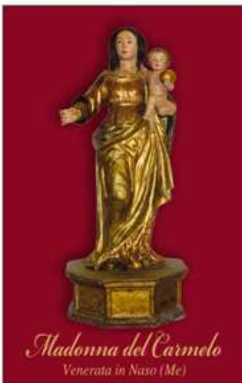
Madonna del Carmelo Venerata in Naso (Me)