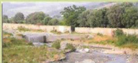
Fiumara regimata con briglie collegate ai muraglioni laterali

Certamente i lavori di stabilizzazione non sempre sono effettuati ad opera d'arte, con il dovuto rigore tecnico-estetico, con il giusto rispetto per la natura, con il minimo impatto ambientale.